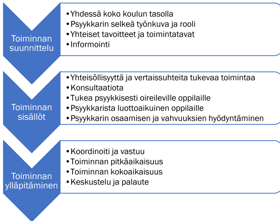
KUVIO 2. Malli psykkaritoiminnan kehittämiseksi (mukaillen Mäenpää 2020)

Edellä esitetty malli on muodostettu opettajien ja psykkarin teemahaastattelujen (N=7) fenomenografisen aineiston analyysin (Niikko 2003; Marton 1994; Huusko & Paloniemi 2006; Uljens 1989) pohjata. Mallissa on huomioitu haastatteluissa esiin tulleet kehittämistarpeet sekä hyvinvointiin ja sen tukemiseen liittyvät käsitykset siitä, kuinka toimintaa tulisi kehittää.